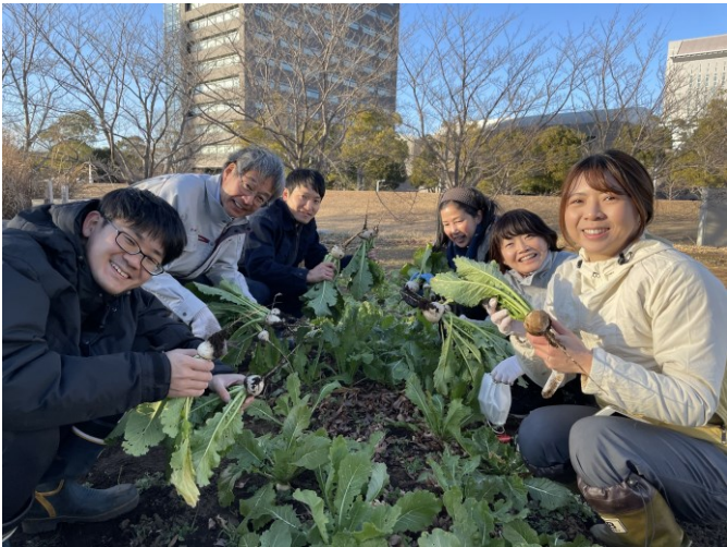
都市農業を活用した交流の例