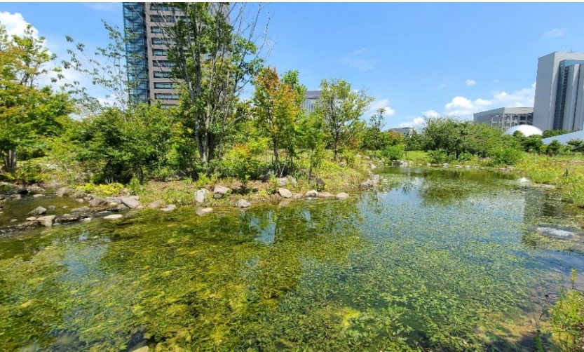
希少な水生植物の生息域外保全